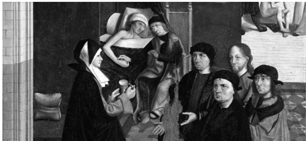
Mistr z Alkmaar: Navštěvovat nemocné, přelom 15.–16. stol.

Jestliže vůbec jako pastoraci, pak jako pastoraci ve výše naznačeném smyslu slova; ale přirozeně především jako výkon justice – tedy, chcete-li, službu spravedlnosti.