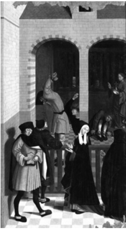
Mistr z Alkmaar: Navštěvovat vězňené, přelom 15.–16. stol.

Ve svém projevu k Římské rotě hovořil papež František o potřebě pastorační konverze církevních struktur – myšleno tak, abychom nabízeli službu spravedlnosti těm, kteří se ve své komplikované manželské či obecněji životní situaci obracejí na církev.