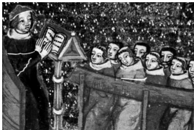
William z Nottinghamu učí univerzitní studenty, asi 1350 (via Wikimedia Commons)

a čistou intonaci, ale především o znalost textu a melodie běžně užívaného liturgického zpěvu. To vše znamenalo, že kandidát kněžského svěcení musel předem prokázat schopnost a dovednost k bezchybnému vedení liturgických i sakrálních úkonů. Kandidát to musel prokázat při zkoušce před biskupovým zmocněncem dříve, než byl zapsán do matriky svěcenců. Kandidáty představoval světiteli arcijáhen obvodu, odkud pocházeli. Ten za ně, za jejich požadované znalosti a současně za to, že splňují další dvě podmínky kněžství, ručil. Těmi byl legitimní původ (nebo alespoň již udělená dispens z illegitimity) a svědectví o tom, že vedou bezúhonný život. Obojí mělo zaručit morální předpoklady pro kněžství. Splnění těchto podmínek dokládal každý kandidát písemnými zárukami dvou osob, obvykle faráře z místa, odkud přicházel, a další významné osoby z jeho kraje. Dodržování tohoto kanonického předpisu v českém prostředí potvrzují dochované písemné doklady: výjimečně ony morální záruky, více je poznámek o výsledku kandidátovy zkoušky nebo pověření examinátora a z let 1395–1416 máme k dispozici dokonce celou matriku svěcenců.