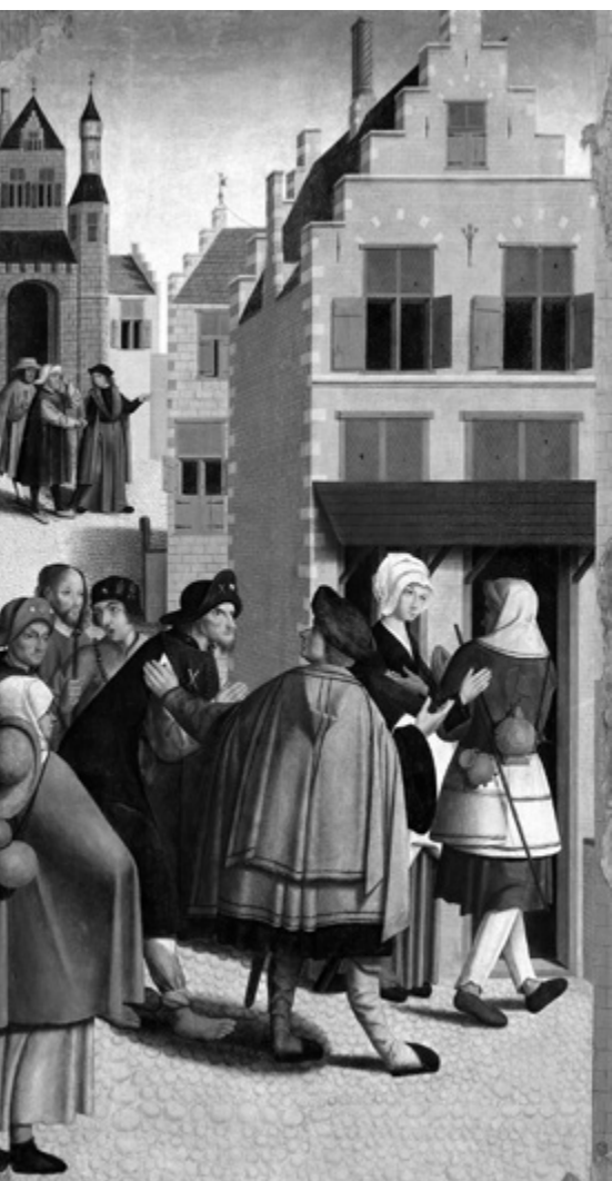
Mistr z Alkmaar: Dát nocleh pocesným, přelom 15.–16. stol.