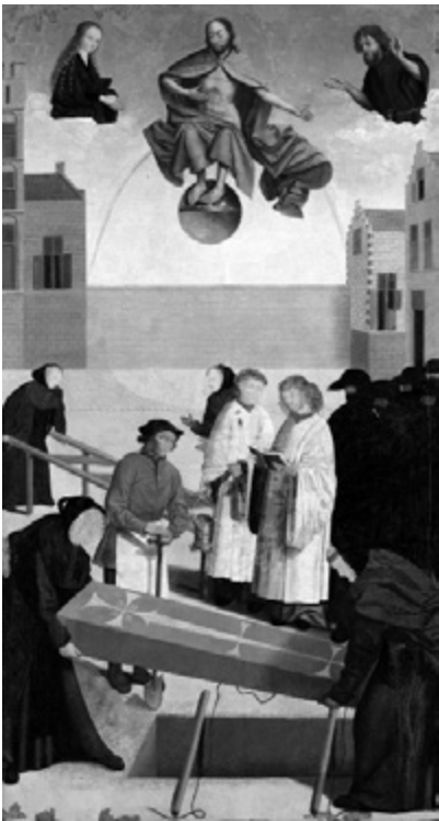
Mistr z Alkmaar: Pohřbívat mrtvé, přelom 15.–16. stol.

Obráťme trochu pozornost k „pozemské praxi“. Jednou z hlavních motivací milosrdenství v křesťanství je právě nápodoba milosrdného Boha: Ježíš říká „budte milosrdní, jako je milosrdný váš Otec“ (Lk 6,36), a říká to dokonce v souvislosti s radikálním požadavkem lásky k nepřátelům (Lk 6,35). Jak vypadá lidské milosrdenství a konkrétní dobročinnost v koránu a islámské praxi?