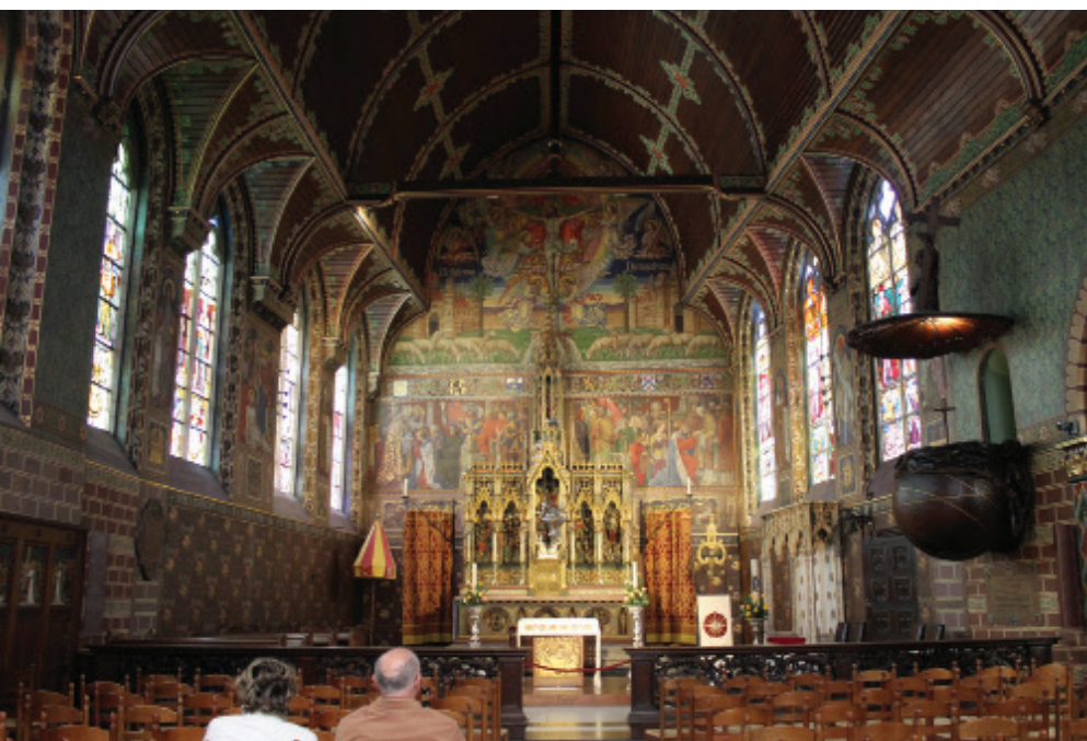
Bruggy, bazilika Svaté krve