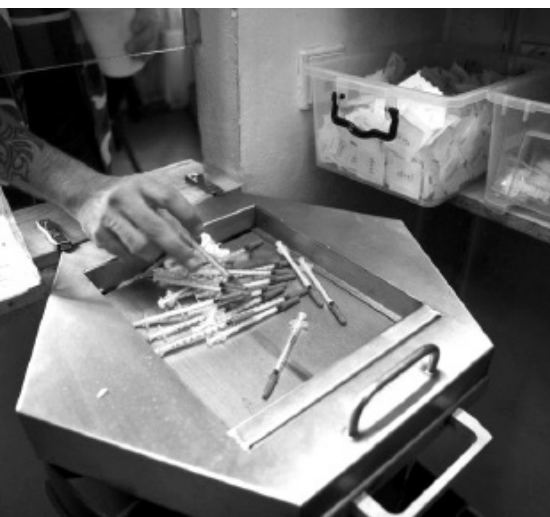
Výměna injekčního materiálu (fotokronika SANINIM)

Ano. Bylo pro mě cenné být u toho, když fakulta v roce 2002 nějakým způsobem začínala znovu, zažívat budování a tvoření nových věcí zevnitř. Bylo to nějak jedinečné a neopakovatelné. Rozhodně k tomu přispěly i přátelské a otevřené vztahy se spolužáky v ročníku a některými přednášejícími.