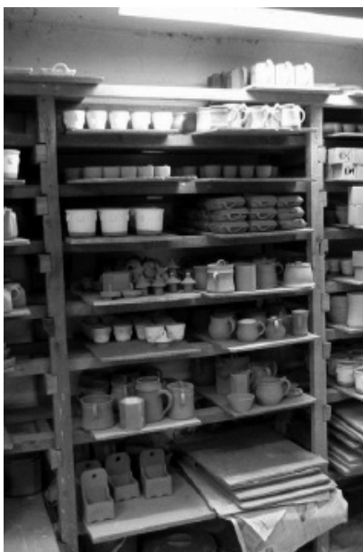
Keramická dílna