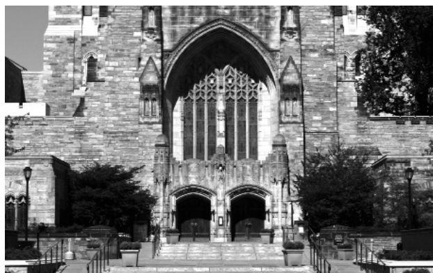
Sterling Memorial Library, hlavní vchod

pořadatelé pozvat nejlepší odborníky doslova z celého světa. Na druhou stranu organizátoři nečekají, že vše bude placeno univerzitou, ale využívají síť mecenášů, kteří na podobné účely značným způsobem přispívají. Právě tady vidím jednu z hlavních inspirací pro český akademický prostor.