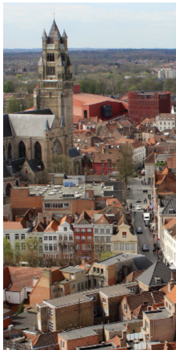
Bruggy, pohled z věže radnice

Více seminaristů a podstatnější vzdělávání v liturgické hudbě. To je má srdeční záležitost.