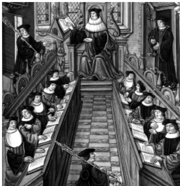
Setkání doktorů pařížské univerzity, 1537

u sv. Klimenta na Starém Městě pražském. U sv. Jakuba v téměř městě působilo nejspíš od 1292, bezpečně od 1336 studium minoritské a u sv. Tomáše na Malé Straně pravděpodobně od počátku 14.st. (bezpečně doloženo 1343) generální studium augustiniánské. Po vzniku univerzity přibýlo ještě studium karmelitánské u Panny Marie Sněžné na Novém Městě pražském a po 1374 studium cisterciácké.