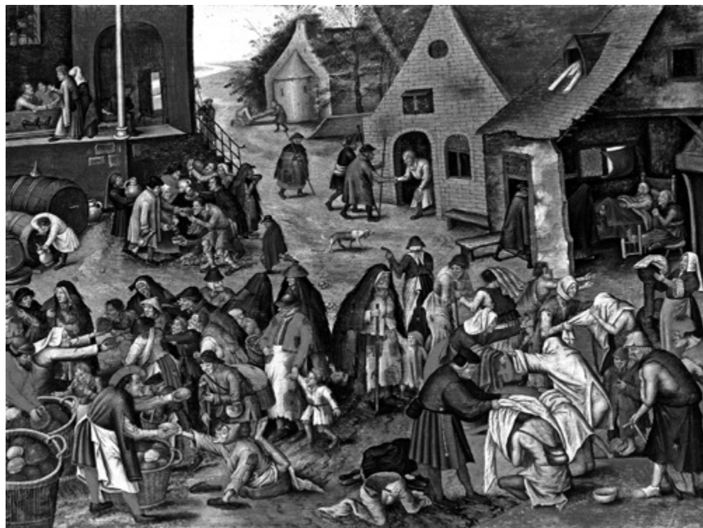
Pieter Brueghel ml.: Sedm skutků milosrdenství, první třetina 17. stol.

Nalezl-li filosof víru, ví ovšem, že jeho touha po milosrdenství byla již ve skutečnosti splněna a že uskutečněním jeho kdysi jen „zoufalé naděje“ na východisko ze smrti a hříchu je ve skutečnosti Ježíš Kristus. Povšimněme si na závěr, že náš Pán není ovšem pouze zjevením Božího milosrdenství, ale zároveň i tělesnou podobou neúprosné Boží spravedlnosti. Spravedlnosti: protože s ním (místo nás) Bůh jednal jako s nejhorším hříšníkem. Božího milosrdenství: protože nikdo, kdo v něho věří, nezemře na věky. Ale ať již pozorujeme našeho Pána z hlediska Boží spravedlnosti, anebo Božího milosrdenství, v každém případě na jeho zmučené tváři vždy spatřujeme odlesk Boží lásky.