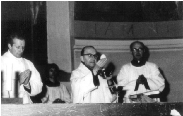
Kněz