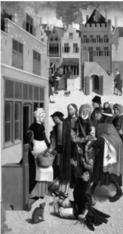
Mistr z Alkmaar: Sytit hladové, přelom 15.–16. stol.

milosrdná (a víra nás učí, že tomu tak je), pak filosoficky nazíráno nezbyvá než říci, že je to výsledkem jeho nevyzpytatelné svobody.