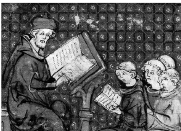
Výuka na univerzitě v Paříži, 14. stol. (via Wikimedia Commons)

Vznik řeholních generálních studií souvisel s centralizovanými a hlavně mendikantskými řády. Jejich vedení rozhodovalo o zřízení a zaměření studií, určených původně jen členům vlastního řádu. Studia měla postupně vzniknout ve všech centrech řádových provincií. V Praze se už ve 13. st. konstitovalo studium dominikánské