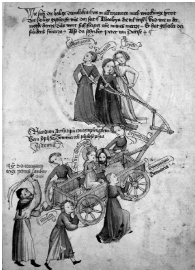
Sedmero svobodných umění poháněných Petrem Lombardským posouvá vůz posvátné teologie, 15. stol.

Příprava na kněžskou dráhu probíhala vesměs nezávisle na univerzitě a bez pevných forem. Existovaly jen základní požadavky, které musel kandidát kněžského svěcení a tím i služby splňovat, a jen ty byly dodržovány a organizačně zajištěny. Musel umět číst a psát, čímž se rozuměla nejen znalost a tvorba písmen, ale též schopnost správně hlasitě přednést napsaný text a samostatně ho stylizovat, a to ovšem v latině jako vyspělém literárním a jediném liturgickém jazyku západu. Musel umět zpívat; a opět tu nešlo jen o dobrý hlasový projev