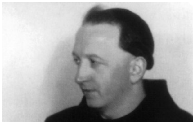
Františkán

Svěcení bez fakulty, mimořádné studium na univerzitě bez maturity, nestandardní cesta k doktorátu. Pro dnešní „strážce vědeckosti“ těžký oříšek. Urban se nestal docentem ani profesorem, arcibiskupem ani monsignorem. Funkci provinciála v l. 1938–1941 bylo těžko závidět. Diecézní proces blahořečení byl zahájen r. 2000. V logice jeho františkánské pokorné cesty by bylo, aby nepokračoval. Rád bych se tu však mýlil.