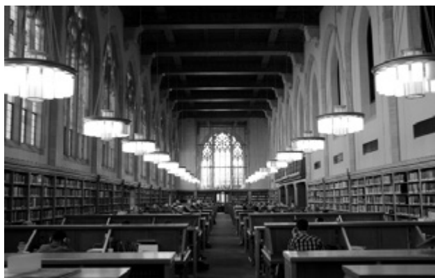
Lillian Goldman law library, hlavní studovna

Zásadní rozdíl mezi věhlasnou soukromou univerzitou a českými poměry je nepřekvapivě materiální zajištění. Vyučující nemusí hledat doplňující zaměstnání, není ani absurdní tlak na „výrobu bodů“, což ale v žádném případě neznamená rezignaci na kvalitu a výkon, právě naopak. Studenti jsou nároční a vzhledem k tomu, kolik je studium stojí, očekávají plné nasazení a špičkové výkony. Předpokládá se systematické rozvíjení výzkumu, který vyvrcholí po několika letech špičkovou, propracovanou a zralou monografií. Během pobytu jsem navštívil řadu dvoudenních historických a teologických seminářů, na které si mohou díky dostatku financí