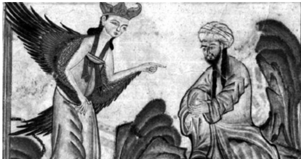
Mohamed přijímá první zjevení od archanděla Gabriela, 1307

Nábožensky to nezdůvodňovali jedni ani druhí, spíše vlasteneckým mottem – všichni jsme Egyptané. Egyptané mají notoricky benigní, mírumilovnou povahu a vesměs se děsí násilí. To je další důvod jejich úsilí o jednotu a smířlivost. Taky důvod důvěry v armádu a vůdce.