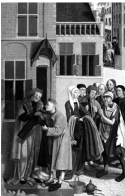
Mistr z Alkmaar: Obléci nahé, přelom 15.–16. stol.

i čtvrtého pokolení“. Ten obrovský matematický nepoměr přímo bije do očí a hovoří jednoznačně ve prospěch Božího milosrdenství vůči hříšnému člověku. Žalm 136, když rekapituluje mocné činy, které Hospodin vykonal pro svůj lid, opakuje v každém verši jako refrén: „jeho milosrdenství je věčné“.