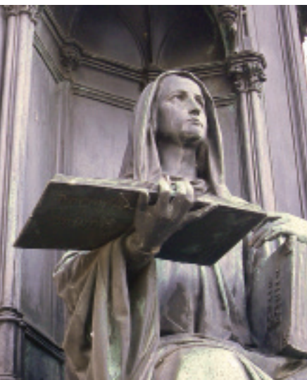
Jacob D. Burgschmiet: Alegorie pražské teologické fakulty, 1842

„Doktorské studijní programy (Ph.D., Th.D.) lze bez nadsázky označit za vlajkovou loď Univerzity Karlovy v Praze. Latinské slovo doktor je odvozeno od docere (učit), případně doctus (učený), a od počátku univerzit označuje nejvyšší vědecký stupeň, kterého lze na univerzitě dosáhnout. Jedná se o životní příležitost profesního i osobního rozvoje pro odhodlané absolventy magisterského studia, neboť pouze zralá osobnost [...] s vlastním vědomostním kapitálem a jasným cílem směřování může vytěžit z možnosti tohoto dalšího studia maximum. [...] Univerzita Karlova v Praze vnímá práci studentů doktorských studijních programů jako důležitý přínos vědeckému potenciálu univerzity jako celku.“ Slova citovaná z dokumentu Základní informace pro studenta doktorského studijního programu (Univerzita Karlova v Praze, 2014) platí i pro Katolickou teologickou fakultu. Na ní jsou uskutečňovány tři doktorské studijní programy: