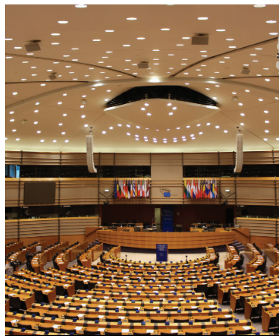
Brusel, hlavní jednací sál Evropského parlamentu