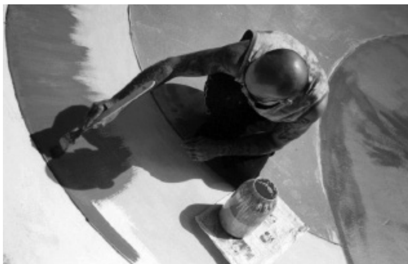
Arteterapie (fotokronika SANINIM)

Z mého pohledu se fakulta soustředí na vzdělávání těch, kteří se věnují pastorační práci v církvi – výuce náboženství, přípravě na přijetí svátostí nebo jejich konkrétnímu vysluhování. Já se setkávám s lidmi – a nejen klienty sociálních služeb – kteří o křesťanství nic nevědí nebo o něm mají zmatené představy a pomýlené informace. Nerozumějí církevním termínům, nevědí, co je to milost, svátost, vykoupění, pod pojmem hřích vidí pouze provinění proti šestému přikázání. Naše „církevní hantýrka“ je pro ně cizí jazyk. Svědčit o Kristu, který mě zachránil, spasil a daroval život, srozumitelnými slovy, jsem se učila v jiném prostředí než na fakultě, a tak jsem toto od fakulty ani neočekávala. Kladu si nicméně otázku, zda by teologická fakulta v misijním území, jímž Čechy jsou, neměla také vychovávat misionáře, nositele a zvěstovatele evangelia. Radostné zvěsti pro ty, kteří o Kristu nikdy neslyšeli. Ty, jimž je rozumět. A záměrně zůstávám u nezodpovězené otázky; jsem si vědoma toho, že zvěstování Krista, Spasitele, je závislé na mém osobním vztahu k Němu, na mém osobním setkání s Ním, na tom, zda Mu dovolím, aby byl skutečně mým Pánem. A to je osobní volba každého, kterou nemůžu garantovat ani sebelepší teologická fakulta.