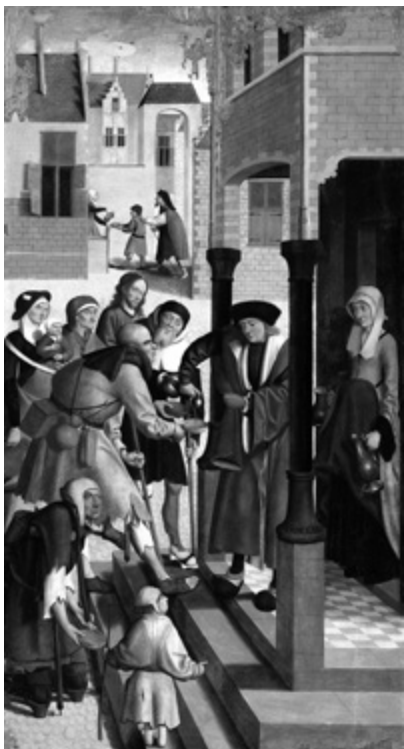
Mistr z Alkmaar: Napojit žíznivé, přelom 15.–16. stol.