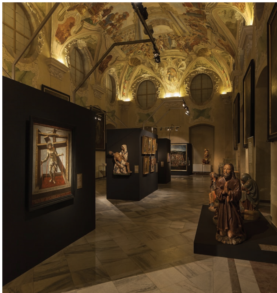
V oplatce jsi všecek tajně