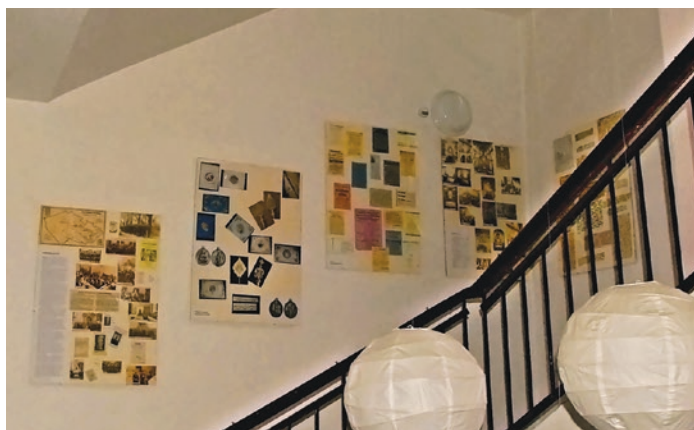
Svatý Ignác v pohybu