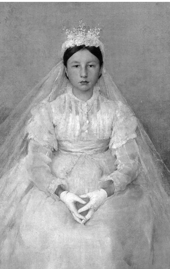
Dívka přijímající poprvé eucharistii, Jules Bastien Lepage, 1848–1884

RT: Když mluvíme o svatém přijímání, je ještě třeba nechat zaznít, jak eucharistie souvisí s přijímáním chudých. Izaiáš říká: Lámej svůj chléb hladovému, popřej pohostinství bloudícím ubožákům . Myslím, že ve svatém přijímání jsme na prvním místě my těmi chudými, kteří potřebují být nasyceni a obdarováni u Pánova stolu.