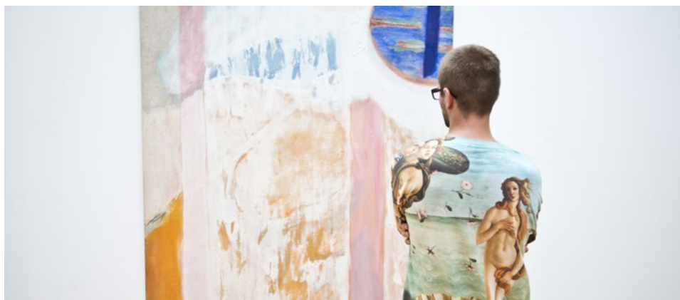
CRASHTEST (foto: V. Šigut; výřez)

CRASHTEST je výstava realizovaná studenty dějin křesťanského umění KTF UK v rámci kurátorského semináře, který vede Milan Pech. Vzniká ve spolupráci s jejich vrstevníky z řad studentů vysokých uměleckých škol. Název vyplývá z podstaty projektu. Je metaforou zátěžové zkoušky studujících kurátorů a umělců, kteří se prvně setkávají při tvorbě výstavy. CRASHTEST je multilaterálním projektem, zvyšujícím odborné a praktické kompetence všech participujících stran. Svou podstatou spojuje jednotlivce a celé instituce, které spolupracují na realizaci společného díla. Proto má široký dopad na všechny, kdo se do něj zapojí. V současné době je připravován 8. ročník, jenž bude mapovat absolventské práce UMPRUM z r. 1993 (Topičův salon, 14. 6. – 4. 7. 2018).