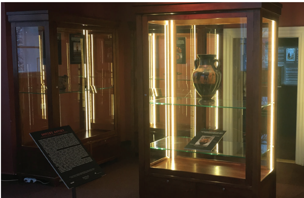
Doteky antiky