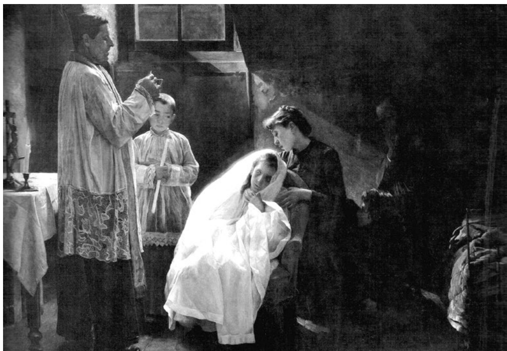
První a poslední svaté přijímání, Cristóbal Rojas Poleo, 1858–1890

DV: Milánská křesťní liturgie obsahuje oproti té římské obřad mytí nohou, tedy tuto službu lásky. Pokřtěný přijímá postoj Krista, který nepřišel proto, aby mu člověk sloužil, ale aby mu sám sloužil. A Kristus nakonec umyl nohy všem. Eucharistie je hostina lásky, kde se vzdávají díky za to, že Kristus se stal pro nás chudým služebníkem – a zároveň nezůstává jen u toho. Protože ta hostina lásky spojila učedníky nejen s Mistrem, který dal příklad, ale také mezi sebou navzájem. Eucharistická bohoslužba je přece něčím, co má církve spojovat a utvářet – a ne rozdělovat. A to mi přijde jako velká výzva pro církve ve dnešní době.