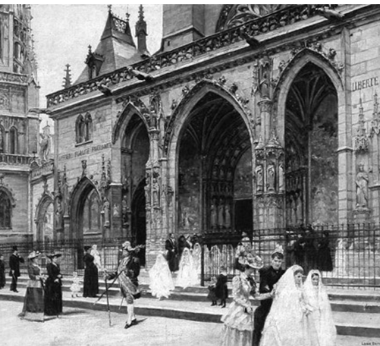
První svaté přijímání, Jean Béraud, 1849–1935