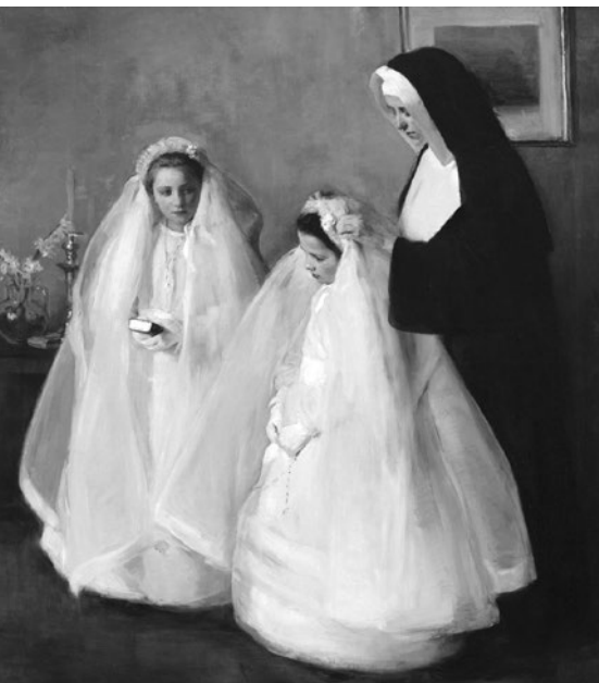
První svatě přijímání, Elizabeth Nourse, 1859–1938

všechno. Chce strávit náš život, aby ho mohl proměnit ve svůj život plný milosti slávy, který pro nás připravil... “ (Alžběta od Trojice, Nebe ve víře)