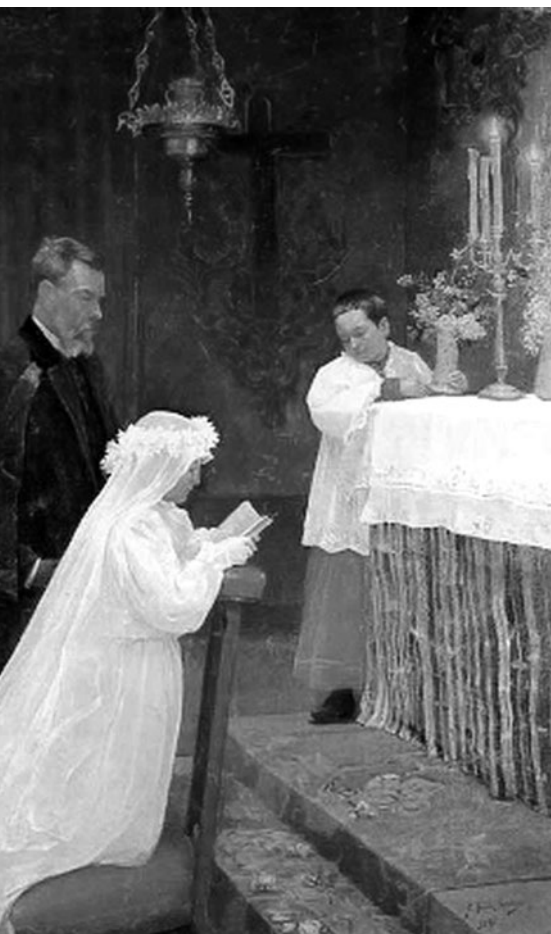
První svaté přijímání (jeho sestra a otec), Pablo Picasso, 1881–1973