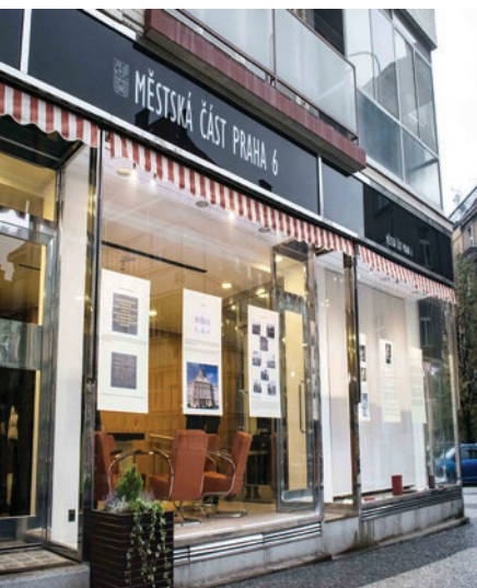
Arcibiskupský seminář

O historii a současnosti budovy Arcibiskupského semináře v Dejvicích se mohli v listopadu 2017 dozvědět návštěvníci expozice, jež byla instalována v Galerii Skleňák. Připravila ji Duchovní správa u Sv. Vojtěcha k výročí 90 let od postavení budovy, a to ve spolupráci s Městskou částí Praha 6, Arcibiskupským seminářem a Katolickou teologickou fakultou. Panely o ní připravila Marie Opatrná.