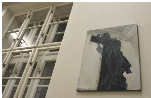
Petr Bardaševský: Mors et Religio