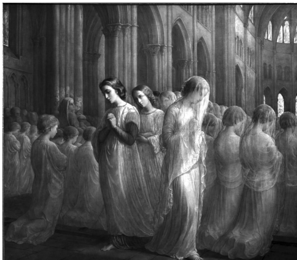
První svaté přijímání, Louis Janmot, 1814–1892

Budeme se velice těšit! Děkuji za rozhovor!