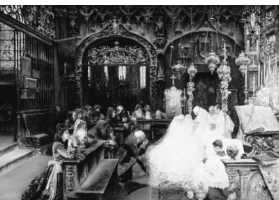
První svaté přijímání, Jose Gallegos y Arnosa, 1857–1917

Dá se říct, že to ke mně přišlo samo a začalo to právě díky retro šatům. Nadto jsem svůj podnik pojmenovala podle své oční vady. Přišlo mi proto namíste, abych i já začala pomáhat. Navíc přímo k nám do obchůdku chodí mnoho lidí, kteří mají nějaký handicap. Například nedávno přišla paní s kyslíkovou bombou. A tito lidé mi sami říkají, že se u nás cítí velmi příjemně. A to mě velmi těší. Začala jsem tedy přemýšlet o tom, že je nejen dobré mluvit o handicapovaných lidech a o jejich konkrétním problému a pomáhat jim, ale také je nějak motivovat. Nyní jsme se například spojili s organizací Pink Bubble, podporující lidi do 30 let, kteří prodělali nebo prodělávají rakovinu. Společně jsme připravili pro Karlínský ples přehlídku, na které půjdou v našich šatech klientky této organizace spolu s herečkami a modelkami. Baví mě těmito lidem pomáhat, motivovat je a podporovat. A do budoucna chceme spolupracovat dál. Pomáhat holkám, které přišly o vlasy. Dodat jim kuráž. Mám v úmyslu podpořit nadaci také finančně, určitými procenty z výdělku. Také plánujeme ještě s dalšími designéry udělat přímo pro tyto ženy módní doplňky.