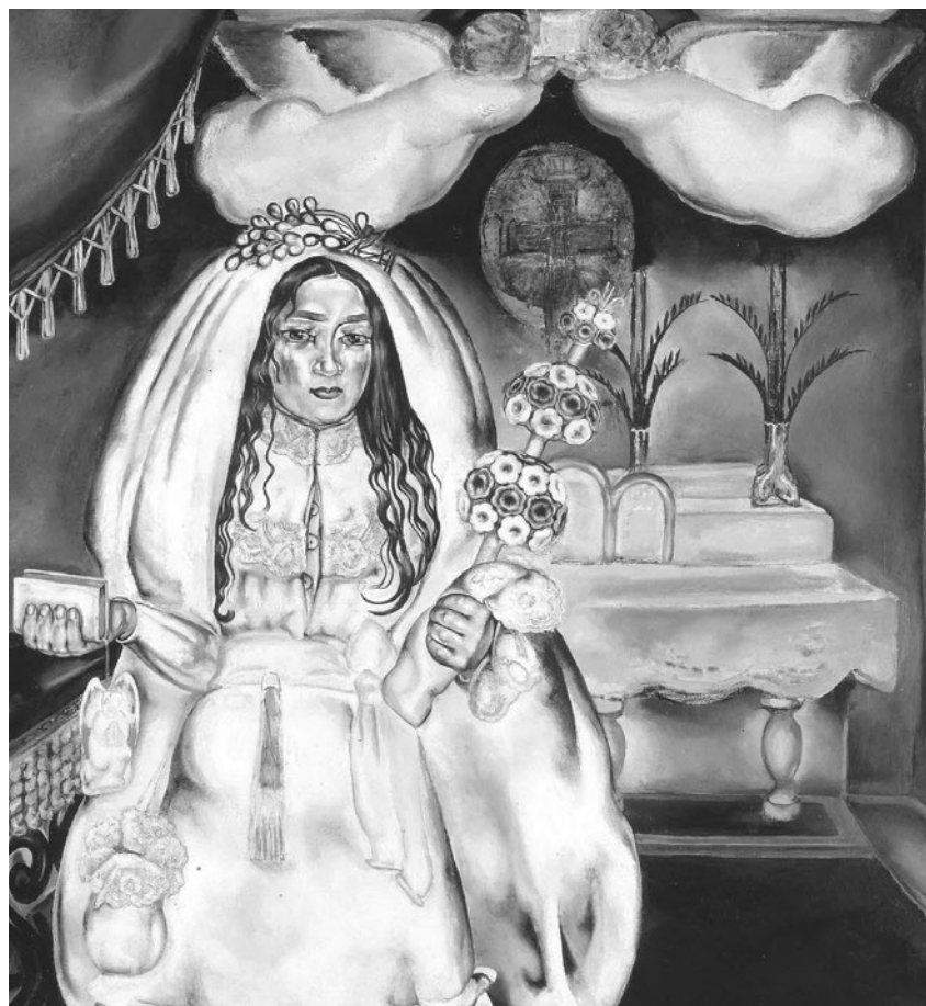
Dívka přijímající poprvé eucharistii, María Blanchard, 1881–1932

Staročeský slovník – úvodní stati, soupis pramenů a zkratek . Praha: Academia 1968