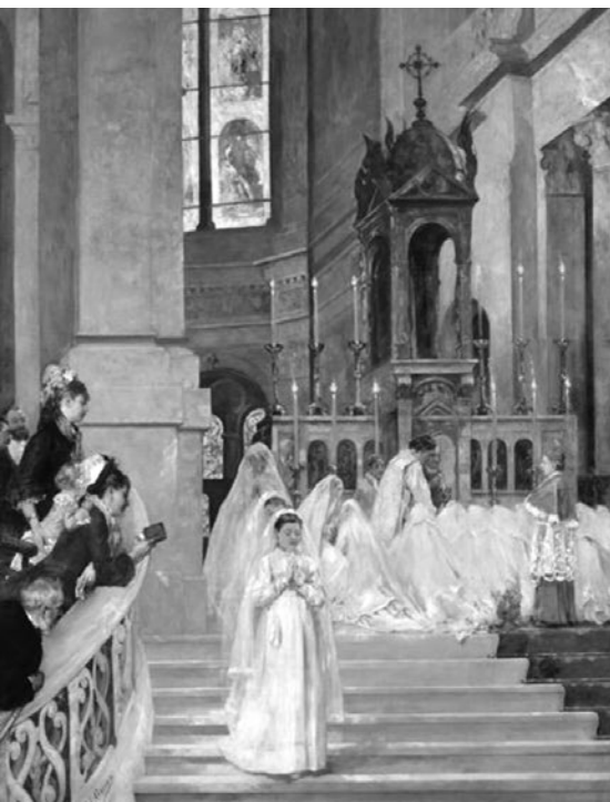
První sv. přijímání v kostele Nejsvětější Trojice, Henri A. Gervex, 1852–1929

DV: To ano. V Eusebiovyh Církevních dějinách se dochoval dopis ze 3. století, který píše Dionýsios z Alexandrie Fabiovi z Antiochie. V něm spojuje přijetí viatika s odpuštěním hříchů, s rozhřešením. A to je také jeden z účinků svatého přijímání, o kterém hovoří také Ambrož a který přejímá také současný katechismus: Kristus ve svatém přijímání člověku odpouští hříchy. A to je další, trochu pozapomenutý rozměr svatého přijímání, kdy se člověk setkává s Kristem odpouštějícím.