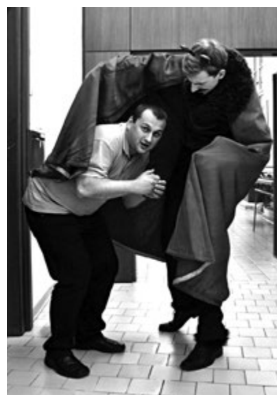
Mikulášská besídka