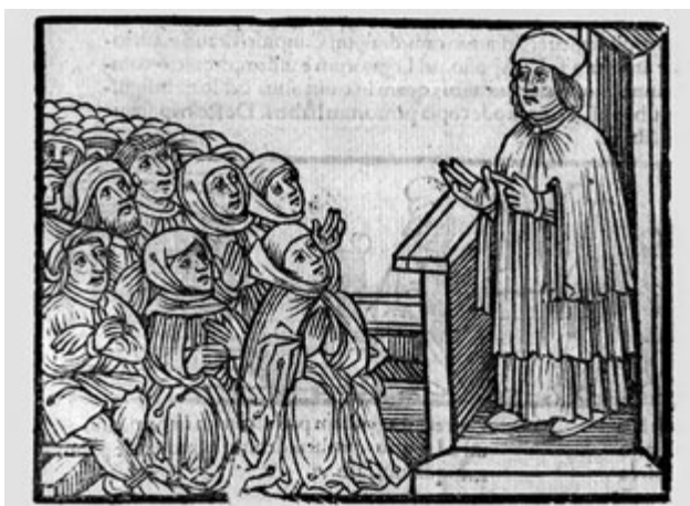
Kázání M. Jana Husa

Mezitím pokračovala i jeho kariéra klerika. V knize svěcenců pražské diecéze ( Liber ordinationum cleri 1395–1416 ) se dozvídáme o Janu Michalovu z Husince, který se hlásil k jáhenskému svěcení 3. dubna 1400 pod titulem boleslavského arcijáhensství, tedy z území severovýchodně od Prahy. Spíše než místo původu však tento údaj může znamenat krajinu počátků duchovní kariéry mladého klerika Jana. Možná že už jako podjáhén získal nějaké obročí v obvodu boleslavského církevního okrsku. O Husově podjáhenském svěcení ani o svěcení kněžském se záznam nedochoval; kniha svěcenců není úplná. Bývalo však obvyklé, že klerik získal všechny tři vyšší stupně svěcení během jednoho roku, jakmile dosáhl věku 24 let. Od r. 1402 až do odchodu z Prahy v r. 1412 působil Jan Hus jako kazatel v Betlémské kapli.