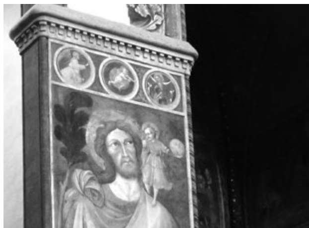
Freska Svatého Kryštofa v kostele San Petronio

Bologna není ochuzena ani o významné kulturní památky. Slavná je svými věžemi, podloubími a převahou cihlových a do červena a oranžova laděných budov, díky nimž působí město uceleným dojmem. Centrum tvoří P.zza Maggiore s bazilikou S. Petronio, zasvěcenou místnímu patronovi. Další významnou památkou je Neptunova kašna na P.zza del Nettuno. Kašna se sochou Neptuna je považována za symbol města a měla připomínat šťastnou vládu papeže Pia IV. Také místní kostely skrývají řadu pozoruhodných památek. Z nejceněnějších jmenujme sochu světlohoše z baziliky di S. Domenico z rukou Michelangelových. Další zajímavostí jsou sousoší Oplakávání, zhotovena nejčastěji z terracotty. Oplakávání v kostele S. Maria della Vita od N. dell'Arcy je zvláště pozoruhodné svou expresivitou a dramatičností. Za zmínku stojí také cyklus fresek v oratoři sv. Cecílie.