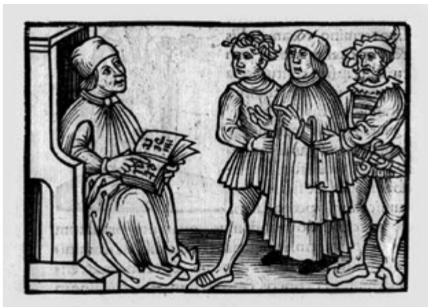
Hus v Kostnici (zdroj: De anatomia Antichristi III, Straßburg 1524)

vu realismu. V teologické rovině se tento spor projevil mj. ve výkladu remanence (přítomnosti způsob chleba a vína v oltářní svátosti i po proměňování). Ještě významnější byla otázka církve, která Husa zaměstnávala až do konce života. Právě Viklefovo pojetí církve (viditelné i neviditelné) bylo Husovi velmi blízké. S tím pak souviselo i chápání poslušnosti vůči pánovi (světskému či duchovnímu), který je ve smrtelném hříchu. To byly později hlavní body Husovy obžaloby při kostnickém procesu.