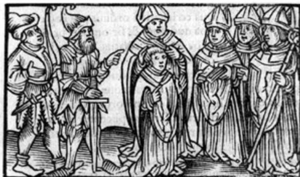
Degradace M. Jana Husa (zdroj: De anatomia Antichristi III, Straßburg 1524)

Naposledy ji navštívil na sklonku léta či na počátku podzimu r. 1414, kdy se připravoval na cestu ke kostnickému koncilu. Praha a její reformátoři, většinou ještě spjatí s univerzitou, spíše ovšem s artistickou fakultou (jako Jakoubek ze Stříbra), už měli vykročeno směrem k revoltě. S pražskými teology se znovu sešel před kostnickým koncilem, kde už ale stáli jednoznačně na straně žalobců. Mezi nimi vynikl v tomto ohledu jeho bývalý přítel Štěpán z Pálče. Ke koncilu se vydal i jeho bývalý učitel a kolega Stanislav ze Znojma, ten ale v Jindřichově Hradci na podzim r. 1414 náhle zemřel. Hus sám byl upálen 6. července 1415.