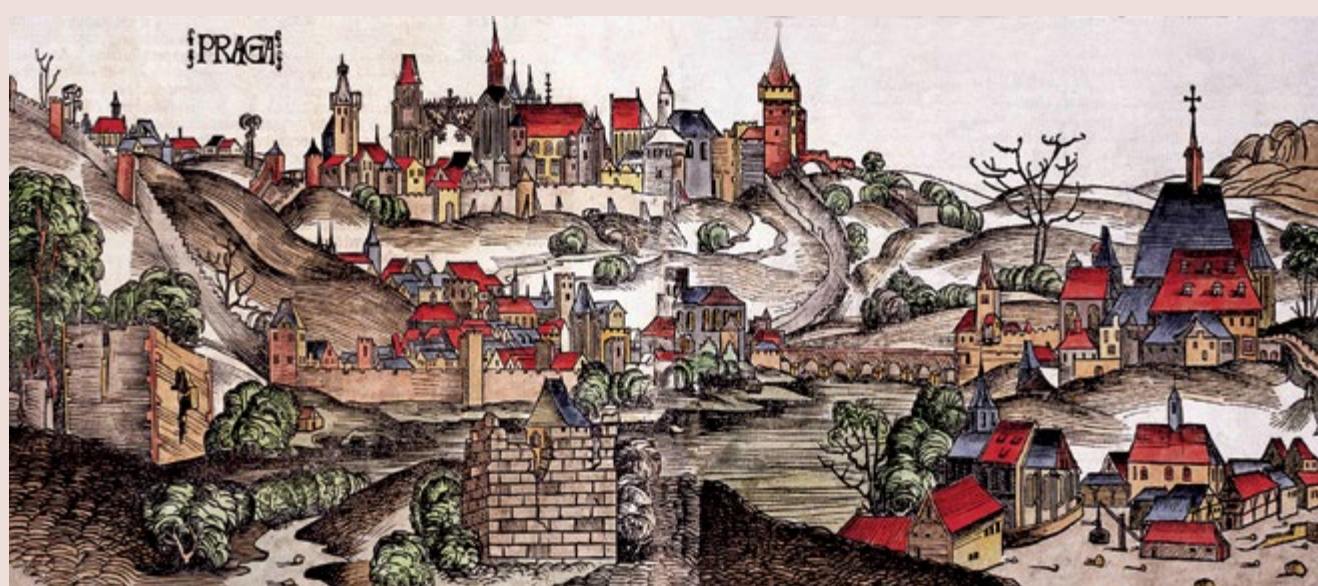
Veduta z kroniky Hartmanna Schedela. Autor: Michael Wolgemut, 1493.