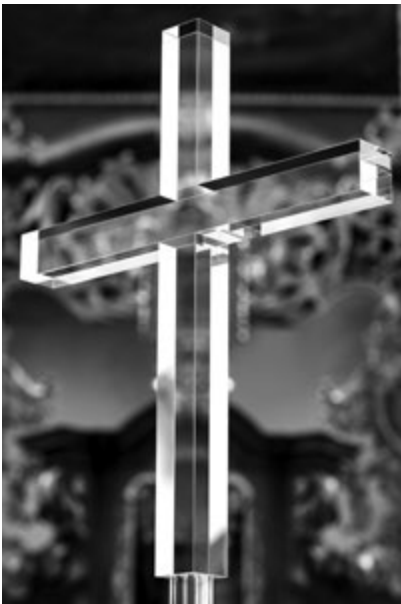
Václav Cigler: Procesní kříž, Klášteřínský kostel Nejsv. Trojice ve Slaném, 2013