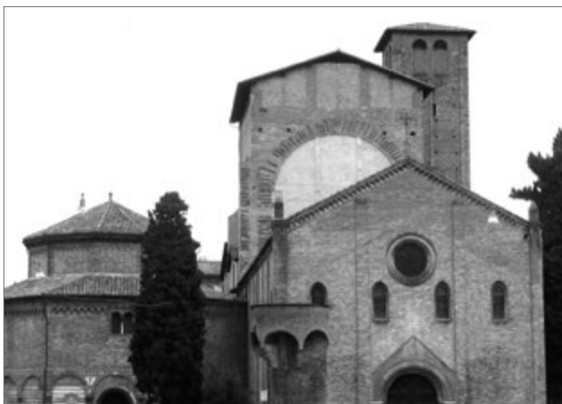
Kostel Santo Stefano

Bolognou procházela od nepaměti hlavní obchodní tepna mezi severem a jihem Apeninského poloostrova. Svoji osadu zde v 6. stol. př. n. l. založili Etruskové. Kulturní nadvládu stvrdilo město založením nejstarší univerzity v roce 1088 a stalo se tak na dlouhou dobu centrem vzdělanosti. V 16. stol. byla Bologna významným městem papežského státu. Karel V., císař Sv. říše římské, zvolil město za místo své korunovace, dne 23. února 1530.