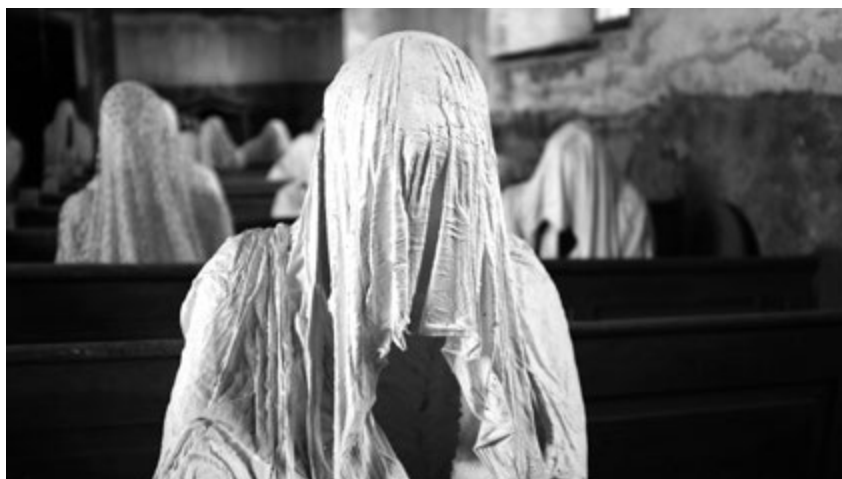
Luková, kostel sv. Jiří

11. 3. zahájilo svou činnost Centrum teologie, filosofie a mediální teorie .