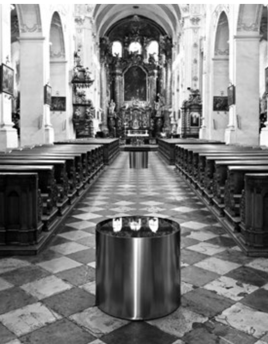
Studánky Václava Ciglera, Nejsv. Salvátor, postní doba 2009

Čtenář začátku exhortace bude žádat o vysvětlení několika předložených formulací. Obejde se intenzivní katolická víra, vyjadřovaná různými způsoby, bez pravidelné účasti na bohoslužbách? Odkdy platí u přehorlivých věrozvěstů pravidlo, že křesťané mají povinnost hlásat Krista nikoli jako závazek či břemeno (čili silou nároku), nýbrž jako pramen radosti, která je přitažlivá?