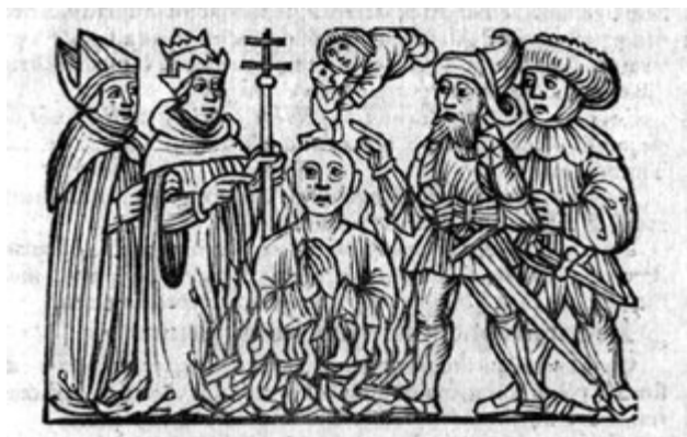
Smrt M. Jana Husa (zdroj: De anatomia Antichristi III, Straßburg 1524)